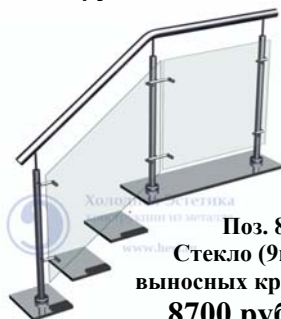
Поз. 8 Стекло (9мм) на выносных кронштейнах 8700 руб./м.п.