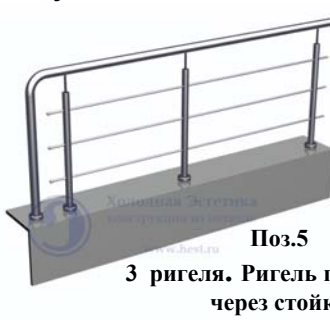
Поз.5 3 ригеля. Ригель пропущен через стойку 4700 руб./м.п.