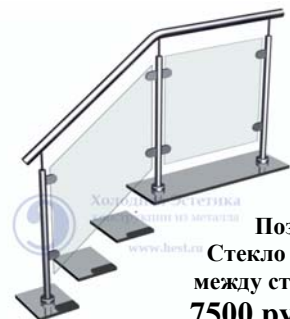
Поз. 7 Стекло (9 мм) между стойками 7500 руб./м.п.

Ограждающие конструкции с заполнением из стекла.