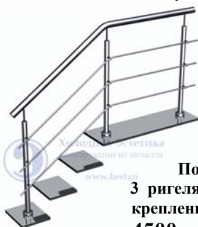
Поз. 4 3 ригеля. Верхнее крепление стойки 4500 руб./м.п.

Лестничные ограждения с ригелями, установленными на выносных кронштейнах (бочонках).