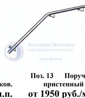
Поз. 13 Поручень прстенный от 1950 руб./м.п.

В типовых конструкциях используется поручень диаметром 51 мм, стойки диаметром 38 мм, ригель диаметром 16 мм, стекло триплекс толщиной 9 мм. Обработка поверхности: полировка либо шлифовка. Ограждения выполняются с соблюдением ГОСТов и СНИПов.