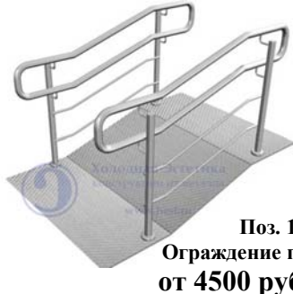
Поз. 11 Ограждение пандуса от 4500 руб./м.п.