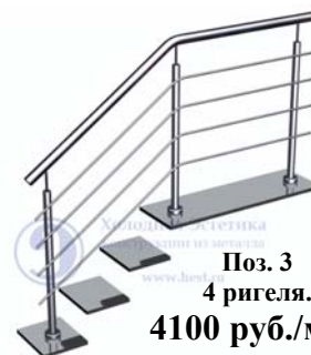
Поз. 3 4 ригеля. 4100 руб./м.п.

Лестничные ограждения с ригелями, установленными на выносных кронштейнах (бочонках).