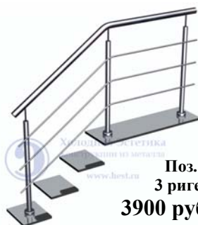
Поз. 2. 3 ригеля. 3900 руб./м.п.