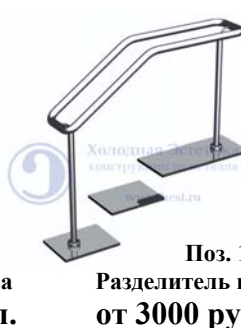
Поз. 12 Разделитель потоков. от 3000 руб./м.п.