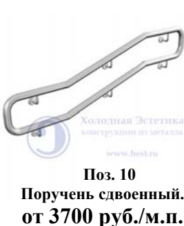
Поз. 10 Поручень сдвоенный. от 3700 руб./м.п.