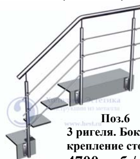
Поз.6 3 ригеля. Боковое крепление стойки 4700 руб./м.п.

Ограждающие конструкции с заполнением из стекла.