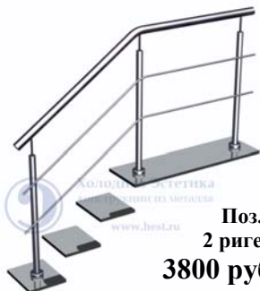
Поз.1 2 ригеля. 3800 руб./м.п.

Лестничные ограждения с ригелями, установленными на аргоно-дуговой сварке.